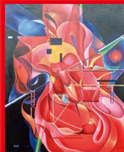
第77回展 美術文化賞 / 堀 悦子「香華 3」