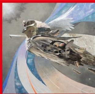
第77回展 会員賞 / 船本 寛「化石-翼」