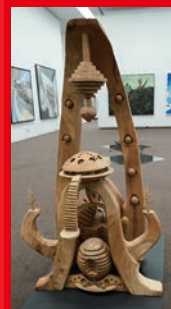
第77回展 会員賞 / 登井 憲志「溝通」