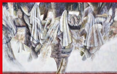
第77回展 会員賞 / 塩原 清美「時を隔む」